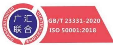
能源管理体系认证标志